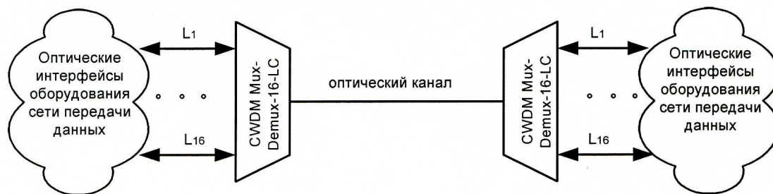
Схема присоединения оборудования к сети связи общего пользования

Мультиплексор/демультиплексор имеет следующие габаритные размеры - 430X44X300 мм и вес XX кг. Мультиплексор/демультиплексор предназначен для создания 16-ти каналов двухсторонней связи по двухволоконному оптическому кабелю. Прибор предназначен для совместной работы с источниками сигналов CWDM с длинами волн 1310 по 1610 нм.